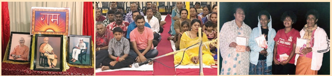
फीजी सत्संग के कुछ चित्र

पूजनीय महाराज जी सर्वप्रथम 2003 में फीजी गए। फीजी दिल्ली से लगभग 12000 कि. मी. दूर दक्षिण प्रशांत (साउथ पसिफिक ) में बसे द्वीपों का एक छोटा समूह है। अंग्रेजों ने सन् 1879 में कई भारतीयों को गिरमिटिया (Indentured labour) मजदूर बनाकर उनके कई जत्थों को फिजी भेजा। तब से आज तक भारतीयों की एक बड़ी संख्या फिजी में रहती आ रही है।